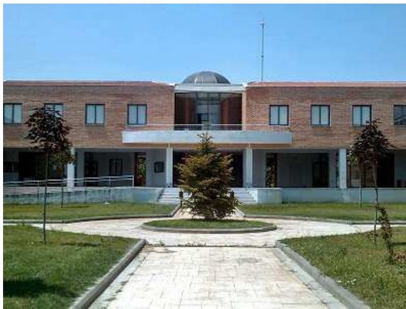
Εικόνα 1. Όψη του κτιρίου του Τμήματος Μηχανικών Πληροφορικής, Υπολογιστών και Τηλεπικοινωνιών

Οι παραπάνω Τομείς υποστηρίζουν διοικητικά και καθορίζουν τις αντίστοιχες ερευνητικές κατευθύνσεις που υποστηρίζονται από το Τμήμα. Η παραπάνω διάρθρωση πληροί αποτελεσματικά τους στόχους και την αποστολή του Τμήματος. Βεβαίως, οι επιστημονικές περιοχές που καλύπτει το Τμήμα υφίστανται ταχεία και διαρκή εξέλιξη. Κατά συνέπεια, είναι πιθανή μία αναδιάρθρωση ή και επέκταση του αριθμού των Τομέων στο μέλλον, λαμβάνοντας υπόψη και την σταδιακή στελέχωση του Τμήματος με νέο Προσωπικό.